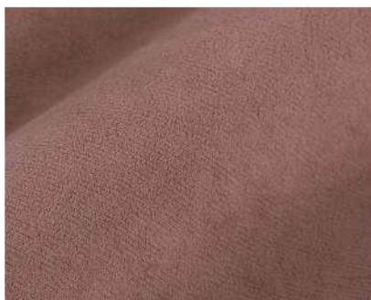
Selfie wood rose