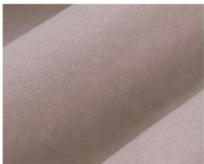
Selfie dusty rose