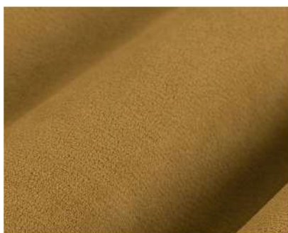
Selfie chai tea