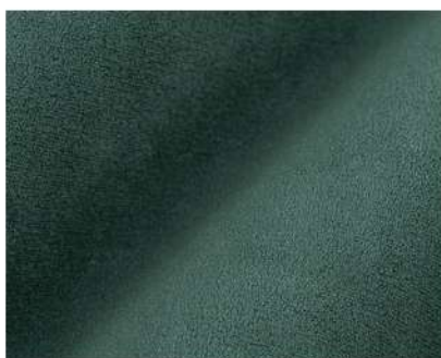
Selfie dusty green