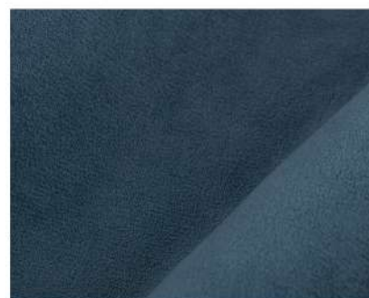
Selfie deep blue