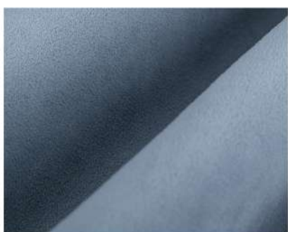
Selfie dusty blue