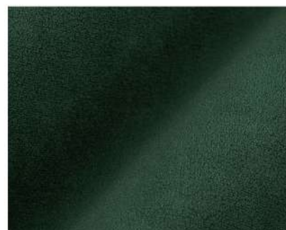
Selfie bottle green