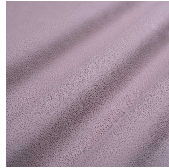
Tokio dusty rose