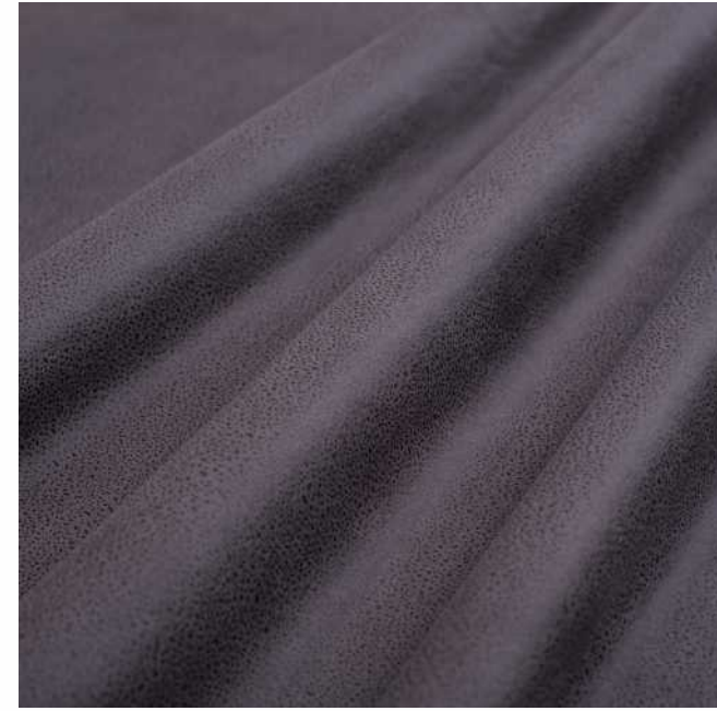
Tokio steel grey